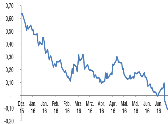
Renditeverlauf 10-jährige Bundesanleihe 2016

In den ehemaligen Problemländern Südeuropas befanden sich die Renditen ebenfalls auf dem Rückzug. Spanien und Italien weisen auf eine Laufzeit von 10 Jahren ein in etwa gleiches Renditeniveau von ca. 1,3% aus. Etwas auffälliger war die Bewegung in Portugal. Entgegen den anderen Staaten in Europa weist Portugal seit einem Jahr ein stetig steigendes Renditeniveau aus. Die Anleger blicken zunehmend skeptischer auf Portugal und preisen mehr Risiko ein.